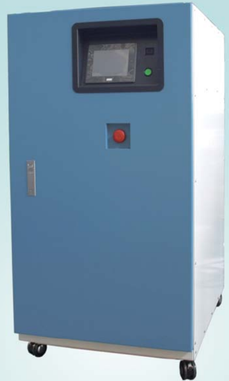
MODEL : TACmini4-18HP